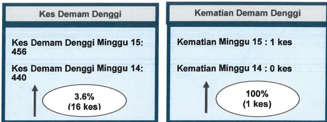
Gambarajah 1: Perbandingan Kes dan Kematian Demam Denggi minggu ke- 14 dan ke- 15 tahun 2021