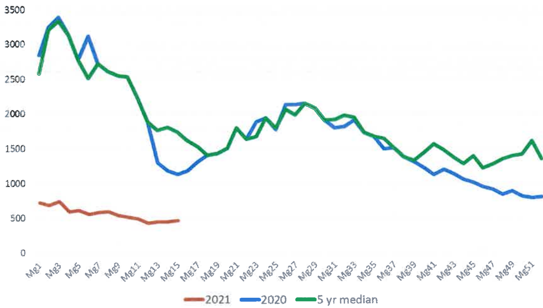
Gambarajah 3: Perbandingan tren kes Mingguan Demam Denggi Malaysia Tahun 2021, 2020 dan Median 2016-2020