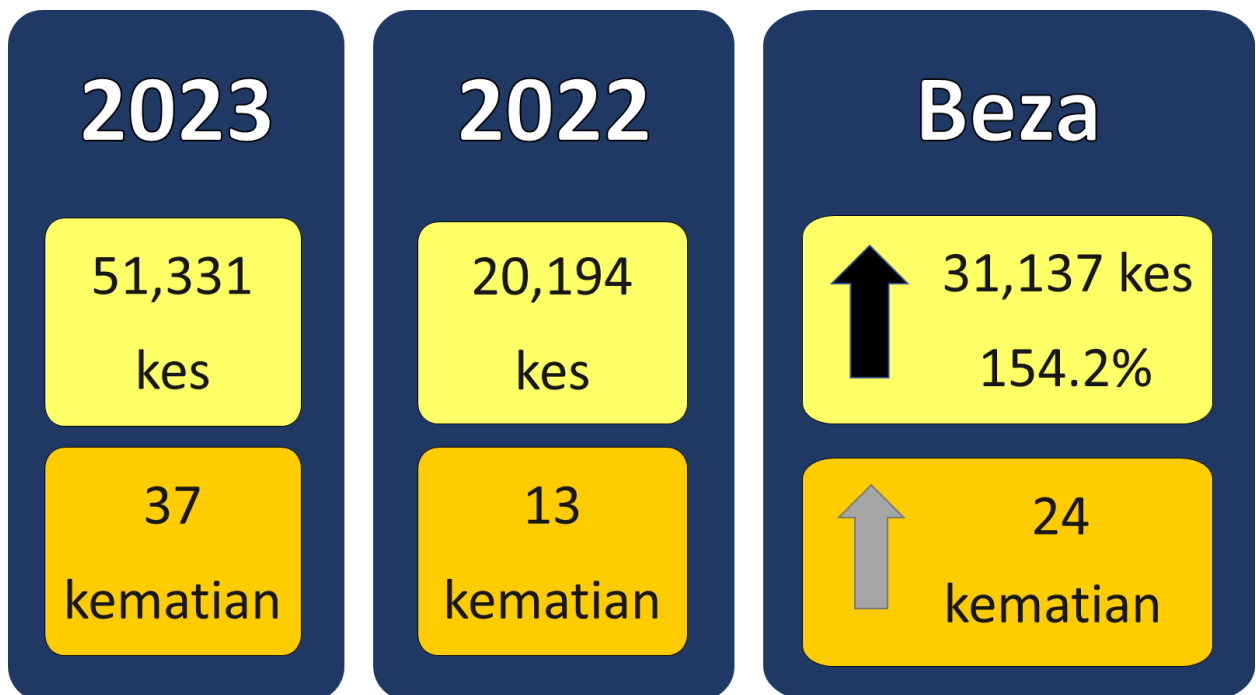
Gambarajah 2: Perbandingan kes dan kematian demam denggi sehingga Minggu Epidemiologi ke-23 tahun 2023 dan tempoh sama tahun 2022