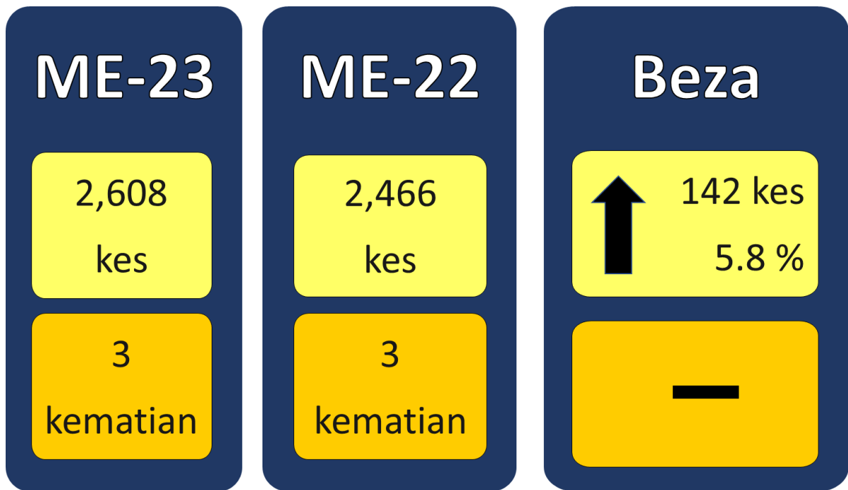
Gambarajah 1: Perbandingan kes dan kematian demam denggi Minggu Epidemiologi ke-23 dan ke-22 tahun 2023