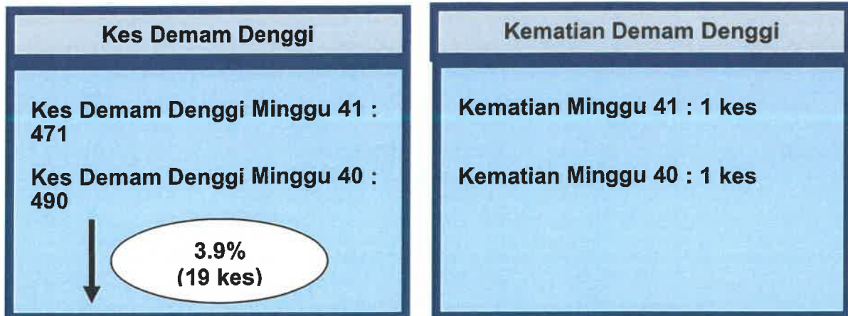
Gambarajah 1: Perbandingan Kes dan Kematian Demam Denggi minggu ke- 40 dan ke- 41 tahun 2021