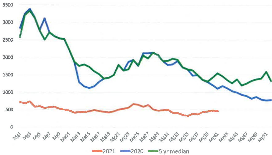
Gambarajah 3: Perbandingan tren kes Mingguan Demam Denggi Malaysia Tahun 2021, 2020 dan Median 2016-2020